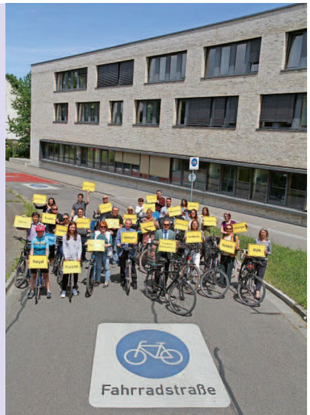
Landrat Hanno Hurth präsentiert zusammen mit Mitarbeitern des Landratsamtes Emmendingen die teilnehmenden Kommunen des Landkreises.

Viel Spaß und Erfolg beim Radeln wünschen Ihnen Ihr Gemeinderat und Ihre Gemeindeverwaltung.